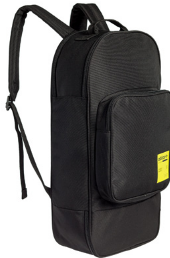
Рюкзак F18 – 4 690 рублей