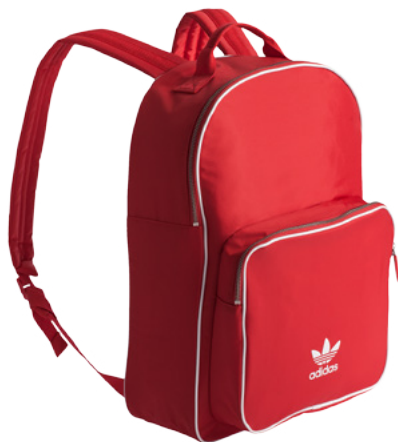
Рюкзак Classic Adicolor – 3 690 рублей